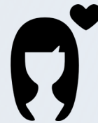
ผู้เสียหาย